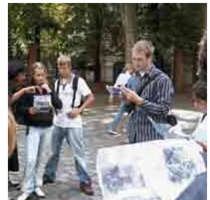
Quellenstudium in Riehmers Hofgarten