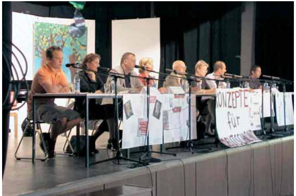
Die Parteien stellen ihre Konzepte für Deutschland vor. Podiumsdiskussion in der Aula der Wald-Oberschule mit den Kandidaten für den Bundestag, organisiert vom Fachbereich Geschichte / Politische Wissenschaften am 2. September 2005

An ähnlichen Wegweisern für Schüler/innen und Eltern wird gearbeitet.